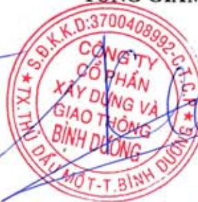
Nguyễn Kim Tiên