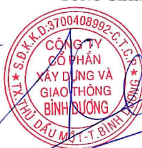
Nguyễn Kim Tiên